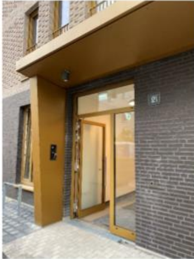
22.04.2021 – Montage des Vordachs über dem Hauseingang Petterweilstraße 21.