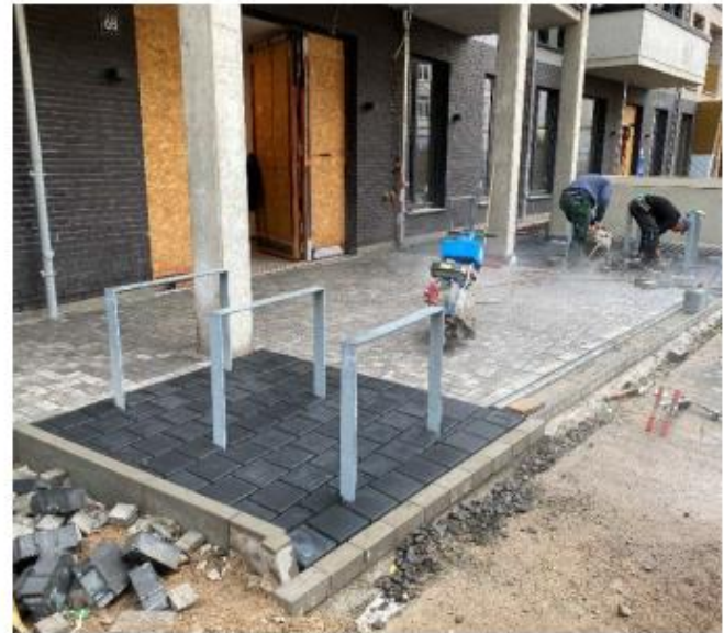
01.04.2021 – Pflasterarbeiten im Bereich Hauseingang Eichwaldstraße 68 und Gewerbeinheit 5.