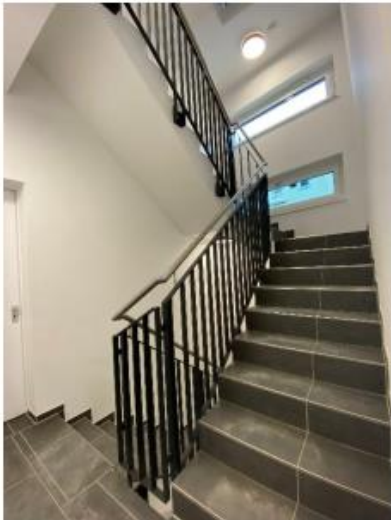
07.05.2021 – Treppenhaus und Flure wurden in Vorbereitung auf die Abnahme vorbegegangen.