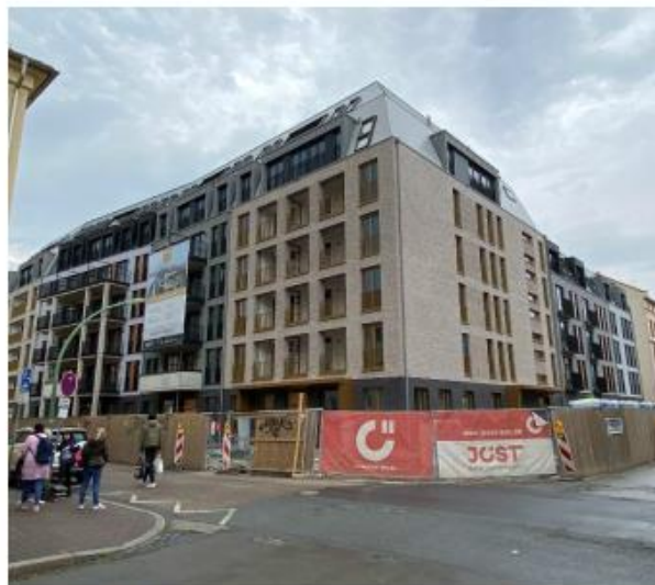
23.04.2021 – Fassadenansicht Ecke Eichwald- / Petterweilstraße.