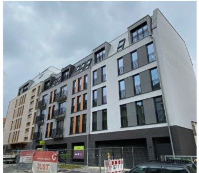
31.03.2021 – Ansicht der Fassade Petterweilstraße.