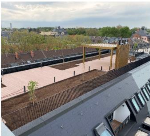
11.05.2021 – Modellieren des Geländes und anpflanzen der Sträucher und Bäume auf der Dachterrasse.