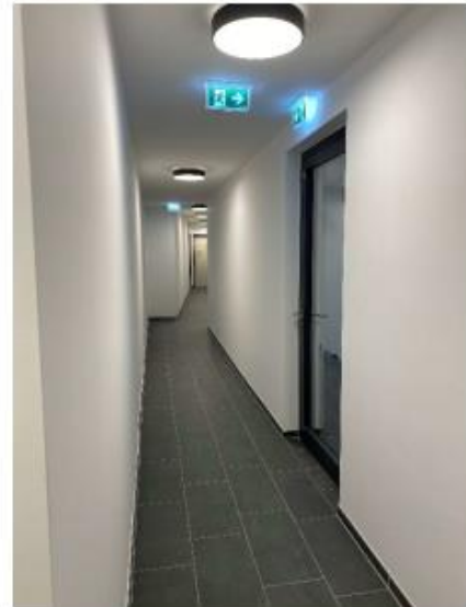
16.03.2021 – Vorbegehungen der Flure vom 1. – 4. Obergeschoss für die Abnahme.