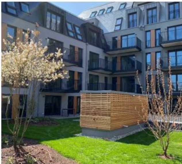
19.03.2021 – Ansicht Innenhof Richtung Eichwaldstraße.