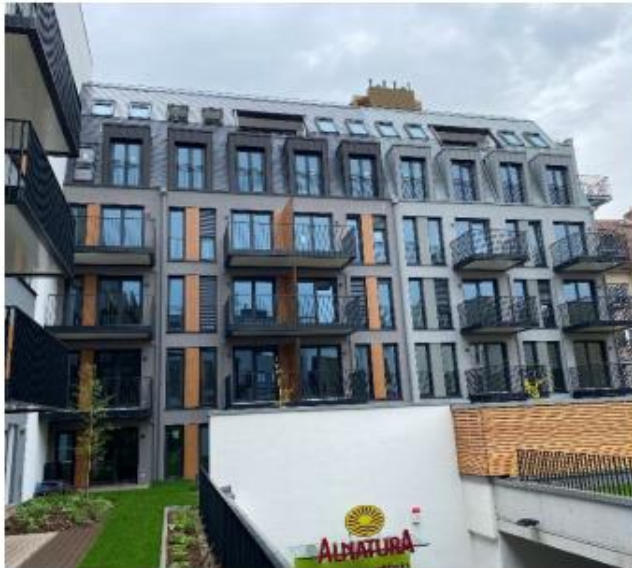
08.04.2021 – Ansicht der Innenhoffassade.