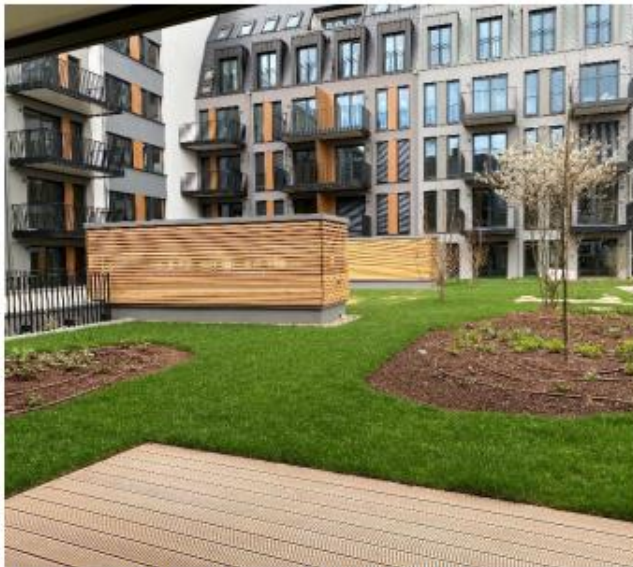
16.03.2021 – Ansicht Innenhof Richtung Burgstraße.