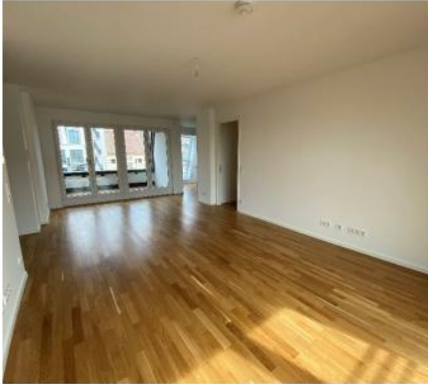
09.03.2020 – In Vorbereitung auf die Abnahme fanden die Vorbegehungen im 1. Bauabschnitt statt.