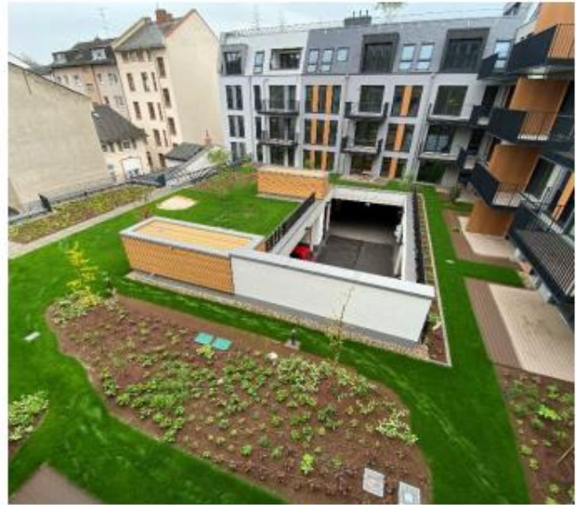
18.03.2021 – Ansicht Innenhof Richtung Petterweilstraße.