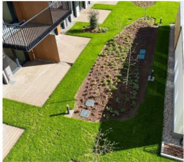
01.04.2021 – Ansicht Innenhof.