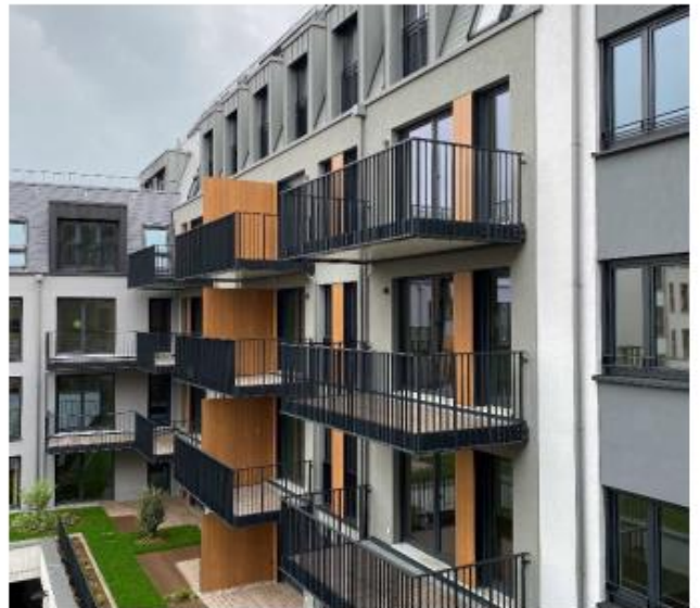
11.05.2021 – Ansicht der Innenhoffassade.