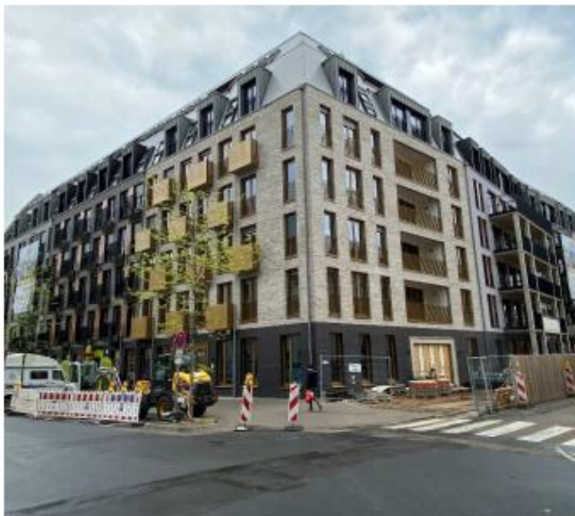
01.04.2021 – Fassadenansicht Ecke Burgstraße / Eichwaldstraße.