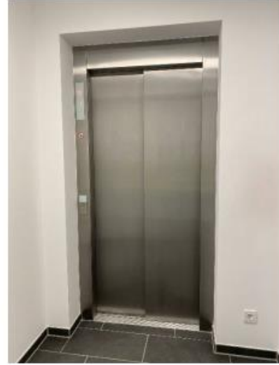
07.05.2021 – TÜV-Abnahme des Aufzuges im TRH B erfolgte am 07.05.2021.