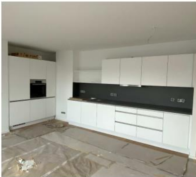
01.04.2021 – Montage der Küchen im 5. und 6. Obergeschoss.