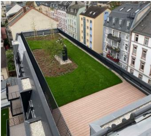
31.03.2021 – Ansicht des Dachgarten oberhalb des 4. Obergeschosses.