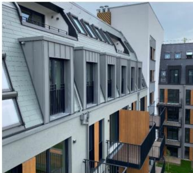
22.04.2021 – Ansicht der Dachfläche Innenhof.