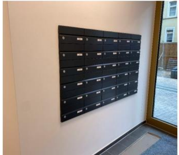
11.05.2021 – Ansicht der Briefkastenanlage im EG Petterweilstraße.