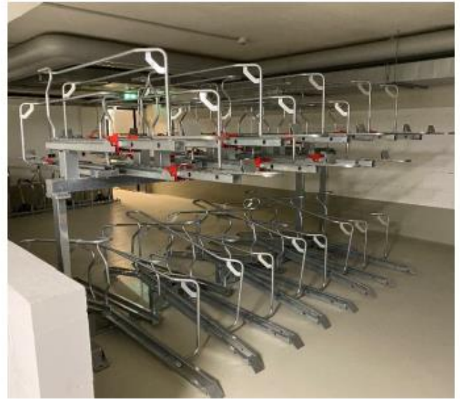
20.04.2021 – Montage der Fahrraddoppelparker in der Tiefgarage.