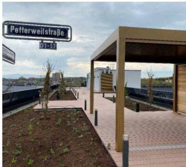
11.05.2021 – Modellieren des Geländes und anpflanzen der Sträucher und Bäume auf der Dachterrasse.