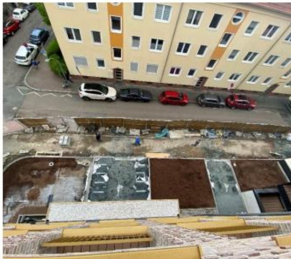
27.04.2021 – Abbau der Sanitärcontainer an der Ecke Eichwald- / Petterweilstraße.