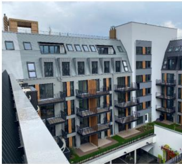
12.04.2021 – Ansicht der Balkone.