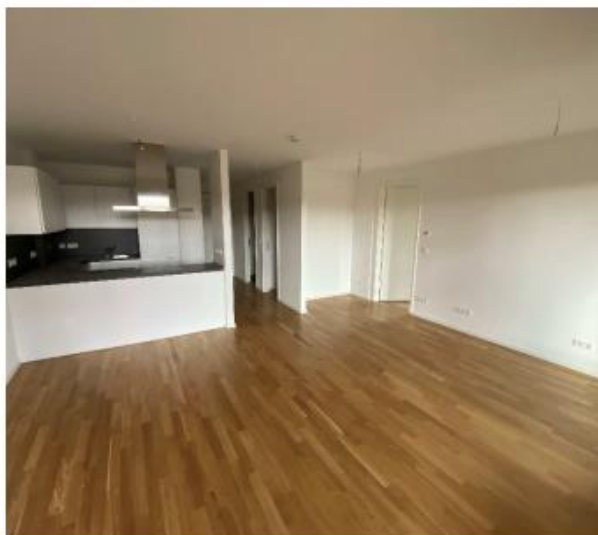
29.04.2021 – In Vorbereitung auf die Abnahme fanden die Vorbegehungen im 1. Bauabschnitt statt.